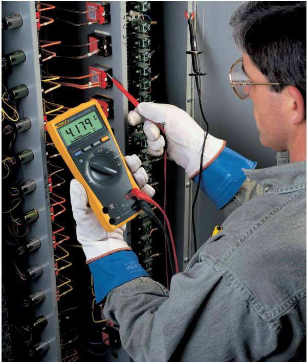
Figur 15.9 Her er det to sikkerhetsbarrierer