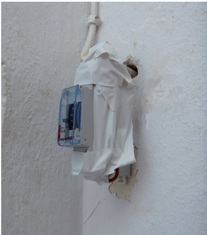
Figur 15.4 Er dette en sikker elinstallasjon?